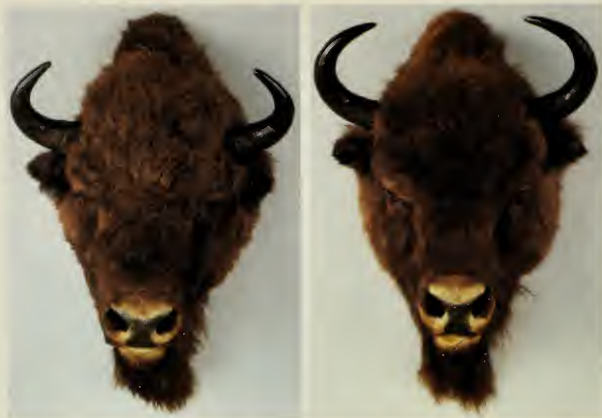
A sinistra: Bisonte europeo ( Bison bonasus L., 1758) - femmina; a destra: Bisonte europeo ( Bison bonasus L., 1758) - maschio.